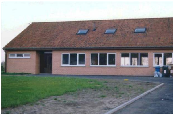
Badgodesberglaan (bij de Lange Munte)

Tot voor 2014 beschikten we over drie locaties: Sinds 21 november 2015 werd ons nieuw lokaal in de Cederlaan geopend. Dit lokaal is veel groter dan voordien en heeft dus een extra grote capaciteit. De vergaderingen van onze takken gaan bijgevolg in twee verschillende lokalen waarin elke tak zijn eigen stekje heeft: